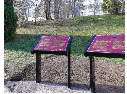
Les deux plaques commémoratives, novembre 2023