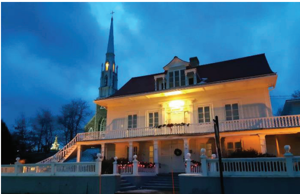
La Maison Chapais en lumière, décembre 2023