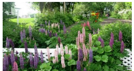
L'entrée des jardins de la Maison Chapais