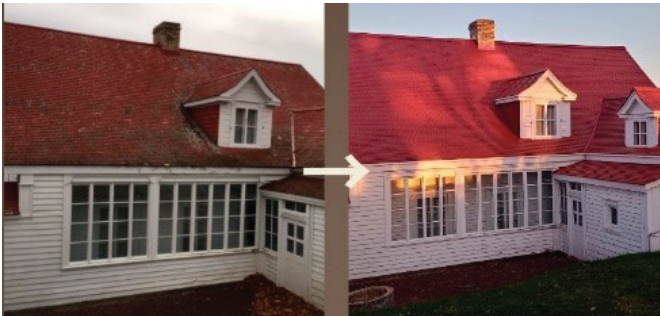
La toiture de la Maison Chapais avant et après les travaux de restauration.

Nous tenons à remercier tous nos partenaires sans qui ce projet n'aurait pu voir le jour : le ministère de la Culture et des Communications, Parcs Canada, la MRC de Kamouraska, la Municipalité de Saint-Denis-De La Bouteillerie, Économie sociale Bas-Saint-Laurent, la Caisse Desjardins Kamouraska-Est, TBC Constructions inc. et Premier Tech ! Merci à tous les donateurs et donatrices qui ont participé au financement de ce colossal projet de restauration.