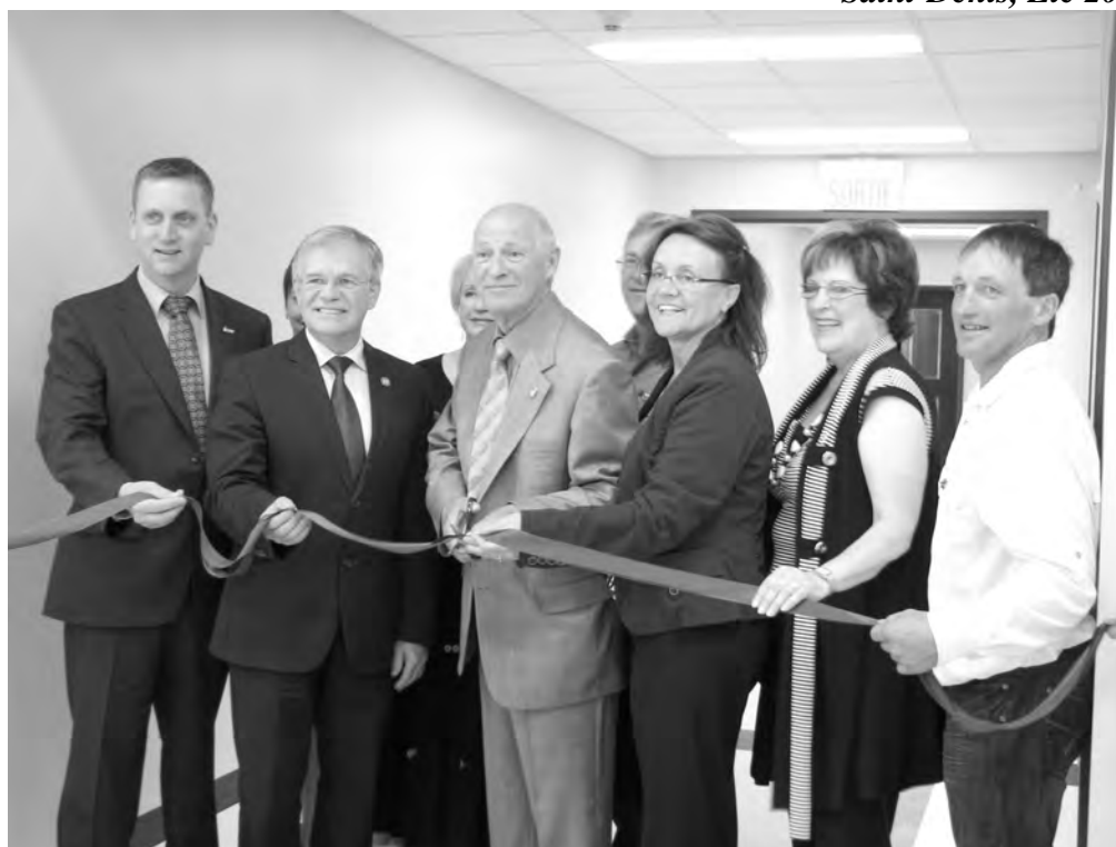
INAUGURATION DU COMPLEXE MUNICIPAL. Texte page.3