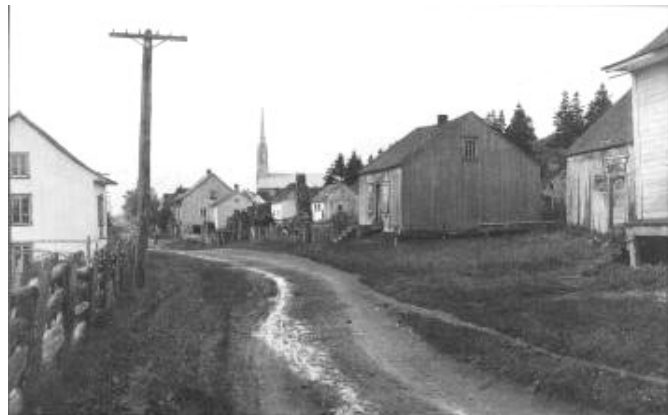
Route 132 côté est