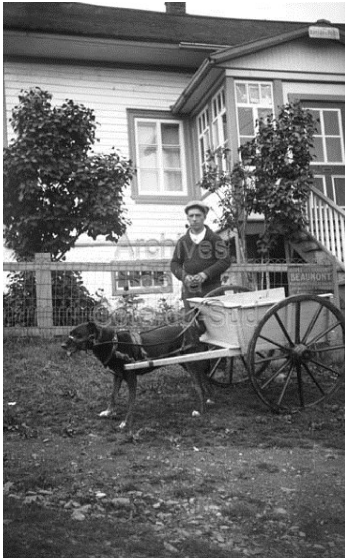
Homme avec une petite charrette tirée par un chien devant le bureau de poste